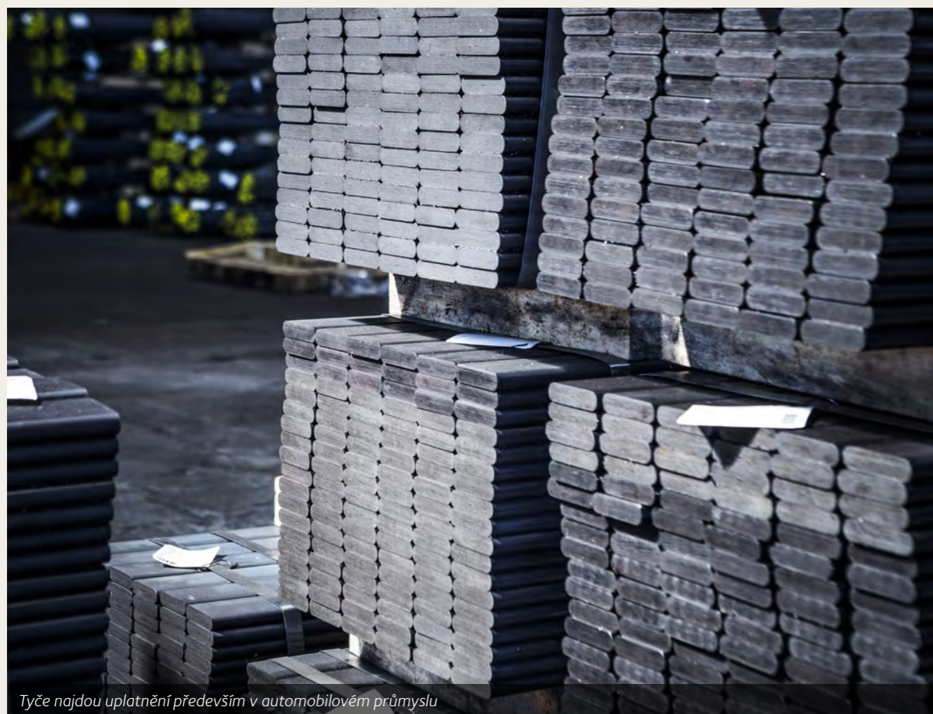
Tyče najdou uplatnění především v automobilovém průmyslu

ArcelorMittal Ostrava vyvinula a jako jediná v evropské části skupiny ArcelorMittal vyrábí ocel, která najde uplatnění především v automobilovém průmyslu. Na středoemné válcovně vyrábí ploché tyče pro listové pružiny, které jsou součástí závěsného systému vozidel. Produkce nového výrobku si vyžádala investici ve výši více než 210 milionů korun.