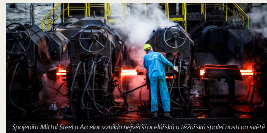
Spojením Mittal Steel a Arcelor vznikla největší ocelářská a těžbařská společnost na světě

Tehdejší světová ocelářská jednička a dvojka se spojily v roce 2006. Za tu dobu společnost ArcelorMittal vyrobila a dodala 890 milionů tun ocelových výrobků, významně investovala do výzkumu a vývoje, do ekologizace i snižování energetické náročnosti. V oblasti BOZP snížila počet závažných pracovních úrazů o 70 %.