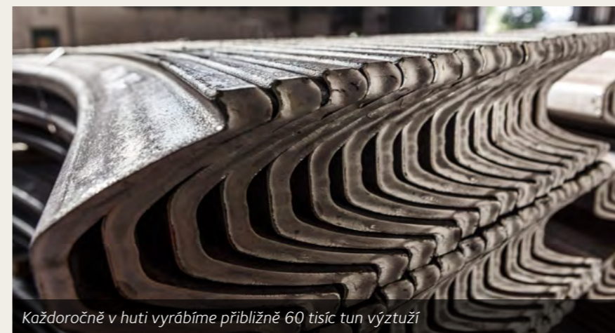
Každoročně v hutí vyrábíme přibližně 60 tisíc tun výztuží

Výztuže z ArcelorMittal Ostrava se nově uplatňují v Jižní Americe a v Africe při výstavbě tunelů nebo těžbě zlata a diamantů.